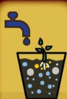
Semaines 1 à 4

BACTREX et 5 ml d' ORGATREX par litre d'eau.