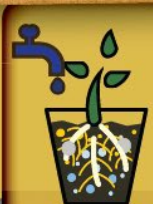
De la semaine 6 à la récolte